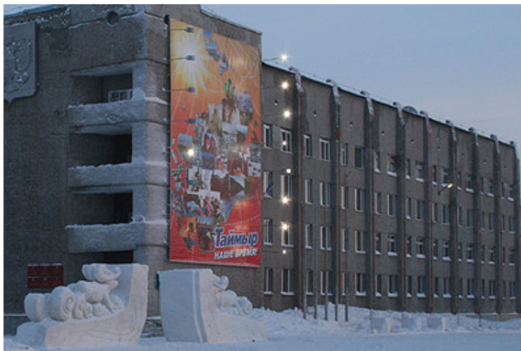
L'administration du raïon municipal du Taïmyr à Doudinka (Photo: © Kaur Mägi).

Plus isolé que les autres du fait de conditions fort peu propices à la vie humaine, l' okroug du Taïmyr, habité aujourd'hui par moins de 40.000 personnes, est encore plus lointain que l' okroug Iamalo-nenets. Son chef lieu est le bourg de Doudinka, qui aujourd'hui fait effet d'un village comparé à la grande ville voisine de Norilsk.